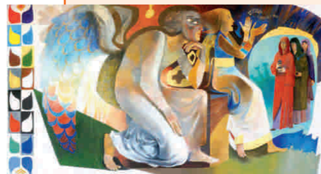
Arcabas - Le donne e gli angeli della risurrezione

"Fu torturato per settimane, ma inutilmente: non fece alcun nome... Il suo piccolo pipel [un piccolo servitore dell'olandese, un bellissimo bambino, dal volto angelico e infelice], messo alla tortura, restò anche lui muto. Allora le "SS" lo condannarono a morte, insieme a due detenuti presso i quali erano state scoperte altre armi... Il capo del campo lesse il verdetto. Tutti gli occhi erano fissati sul bambino. Era livido, quasi calmo, e si mordeva le labbra. L'ombra della forca lo copriva... I tre condannati salirono insieme sulle loro seggiole... "Viva la libertà", gridarono i due adulti. Il piccolo, lui, taceva. "Dov'è il Buon Dio? Dov'è?", domandò qualcuno dietro di me. A un cenno del lager führer le tre seggiole vennero tolte. Silenzio assoluto. Poi cominció la sfilata. I due adulti non vivevano più... Ma la terza corda non era immobile: il bambino viveva ancora... Più di una mezz'ora restò così, a lottare fra la vita e la morte, agonizzando sotto i nostri occhi. E noi dovevamo guardarlo bene in faccia. Era ancora vivo quando gli passai davanti. La lingua era ancora rossa, gli occhi non ancora spenti. Dietro di me udii il solito uomo domandare: "Dov'è, dunque Dio?" E io sentivo in me una voce che gli risponde-