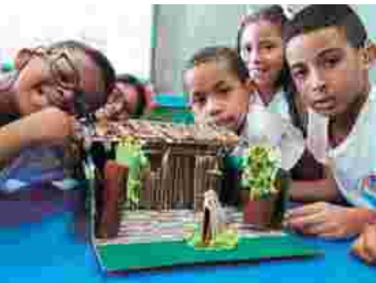
Alunni del ciclo basilico di alfabetizzazione che frequentano il laboratorio di creatività, di storia e costruzione dell'ambiente in cui la storia si svolge.